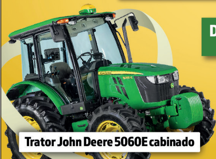
Trator John Deere 5060E cabinado

DOAÇÃO: R$2.000,00 com 25 chances de ganhar!