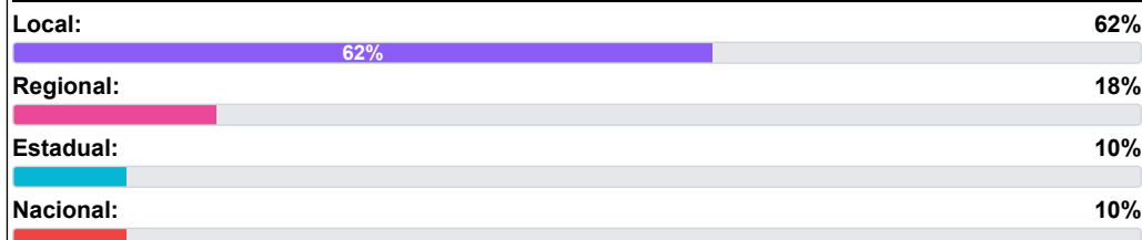
TABELA DE BANNERS