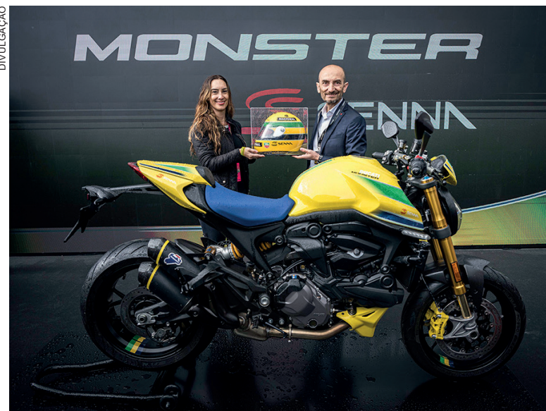
A Ducati Monster Senna foi apresentada oficialmente em Ímola, durante o Grande Prêmio de Fórmula 1

“Sabemos da importância que o Ayrton tem para o Brasil e o mundo e, por isso, apostamos em parcerias de longo prazo, produtos com elementos que permitam diferenciação de performance e procurem, de alguma forma,